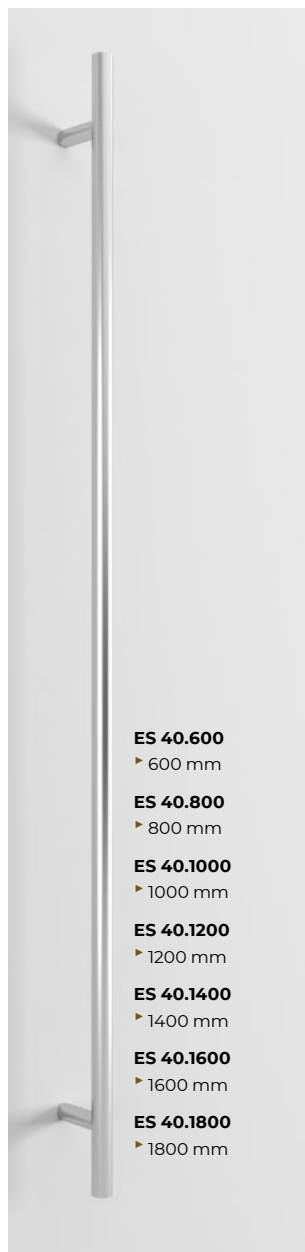
ES 40 Stoßgriff Serie ES 40.600-1800 mit geraden Stützen Edelstahl feinmatt poliert