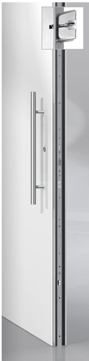
ES 1100 GU Automatic 3-fach Verriegelung hellverzinkt mit durchlaufender verstellbarer Schließleiste